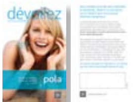
Flyer Pola pour accompagner les factures Réapprovisionnement M770226