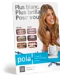
Affichage Pola Avant et après Réapprovisionnement M100097