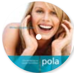
DVD de démonstration salle d'attente Pola Office Réapprovisionnement M770985