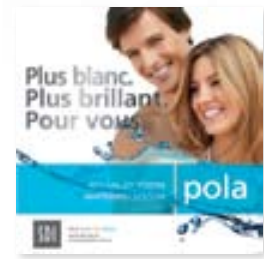
Élément de plafond Pola Réapprovisionnement M100099