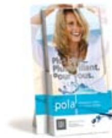
Distributeur Pola de brochures patient Réapprovisionnement M100098