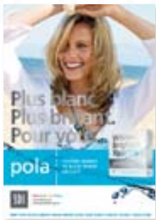
Affiche Pola modèle féminin seulement Réapprovisionnement M100096