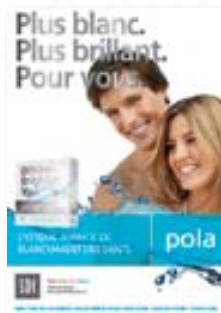
Affiche Pola modèles masculin et féminin Réapprovisionnement M100093