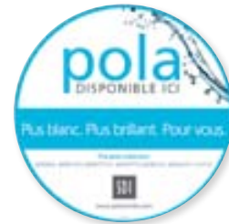
Autocollant de fenêtre Pola Réapprovisionnement M100100