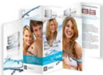
Brochures patient Pola Réapprovisionnement M100125