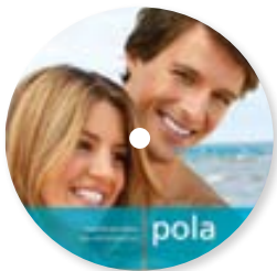
DVD de démonstration pour professionnels Pola Office Réapprovisionnement M770954