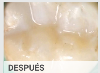
Dr. Gregor Thomas (Germany)

// 8565012 Bulk Fill 20 x 0.25g Repuestos Complet // 8560012 Bulk Fill 1 x 4g Repuestos de jeringa