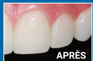
Dr Hugh Flax (USA)