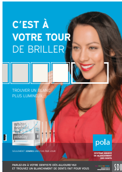
AFFICHE POLADAY Reorder M100317

OUTILS MARKETING POUR LA PROMOTION DU BLANCHIMENT DENTAIRE AUPRÈS DES PATIENTS.