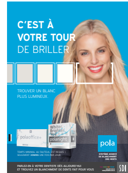
AFFICHE POLAOFFICE+ ET POLANIGHT Reorder M100319