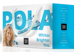
POLA SAC Reorder M100141