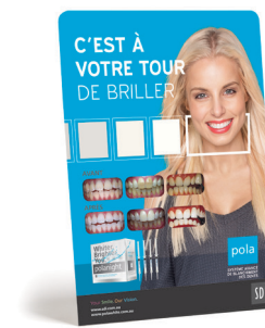
AFFICHAGE POLA AVANT ET APRÈS Reorder M100316