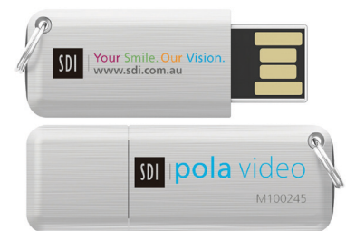
POLA SALLE D'ATTENTE USB VIDEO Reorder M100245