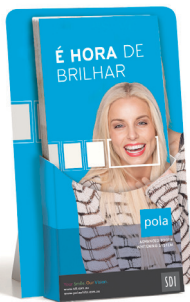
DISTRIBUTEUR POLA DE BROCHURES PATIENT Reorder M100290