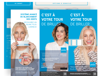
BROCHURES PATIENT POLA Reorder M100314