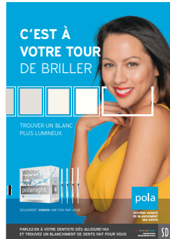
AFFICHE POLANIGHT Reorder M100318