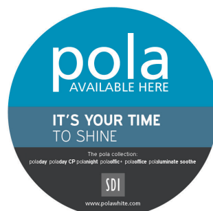
AUTOCOLLANT DE FENÊTRE POLA Reorder M100289