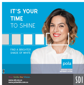
ÉLÉMENT DE PLAFOND POLA Reorder M100293