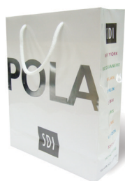
POLA SAC Reorder M100143