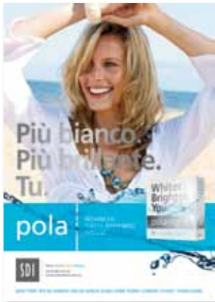
Poster Pola solo donna Riordino M100087