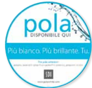
Vetrofania Pola Riordino M100092