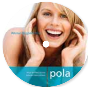
DVD dimostrativo per sala d'attesa Pola Office Riordino M770985