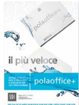
Pola Poster Pola Office+ Riordino M100088