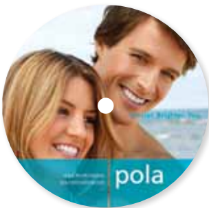
DVD dimostrativo professionale Pola Office Riordino M770954