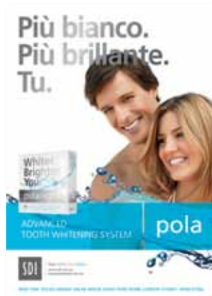
Poster Pola donna e uomo Riordino M100085