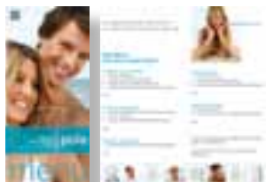
Pola - menu Nr katalogowy M770030