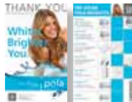
Pola – kartki z podziękowaniem Nr katalogowy M770032