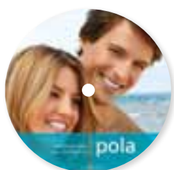
Pola Office prezentacja na DVD (profesjonalna) Nr katalogowy M770954