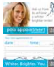
Pola – karta wizyt Nr katalogowy M100102