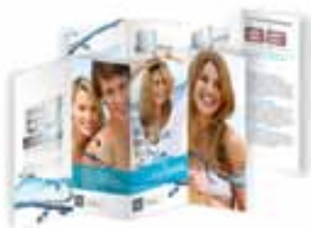
Pola – ulotki dla pacjentów Nr katalogowy M770250