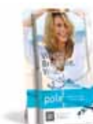
Pola – stojak na ulotki dla pacjentów Nr katalogowy M100041