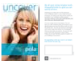
Pola – broszury z miejscem na uwagę / opinię pacjenta Nr katalogowy M770229