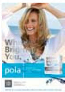
Pola – plakat (kobieta) Nr katalogowy M770130