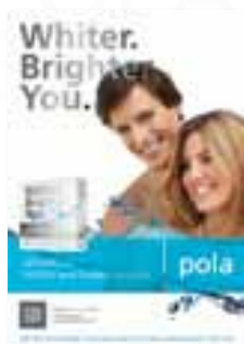
Pola – plakat (kobieta i mężczyzna) Nr katalogowy M770143