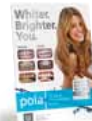
Pola – stojak – przed i po Nr katalogowy M100044