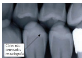
Cáries não detectadas em radiografia