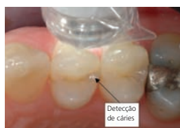
Deteção de cáries