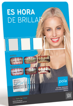
PANFLETO ANTES Y DESPUÉS DE POLA CON SOPORTE Pedido M100351

SOPORTE MARKETING PARA PROMOCIONAR EL TRATAMIENTO DE BLANQUEAMIENTO DENTAL EN SU CLÍNICA.