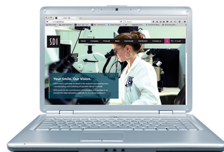
MATERIAL PROMOCIONAL PERSONALIZADO Más material promocional personalizado se encuentra disponible mediante descargas. Visite: www.sdi.com.au