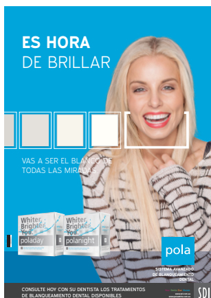
PÓSTER POLADAY Y POLANIGHT