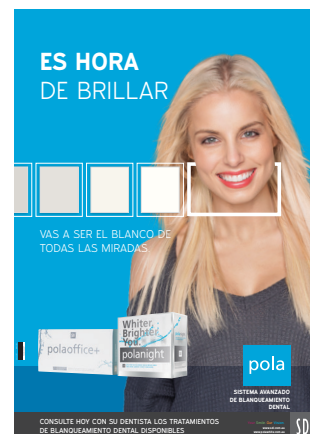
PÓSTER POLAOFFICE+ Y POLANIGHT