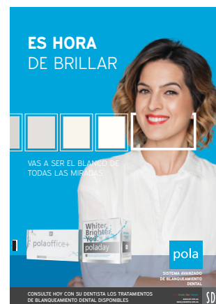
PÓSTER POLAOFFICE+ Y POLADAY