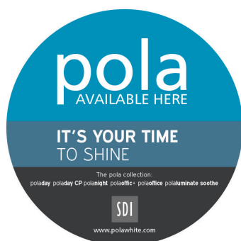
CALCOMANÍA POLA PARA VENTANAS Reorder M100289