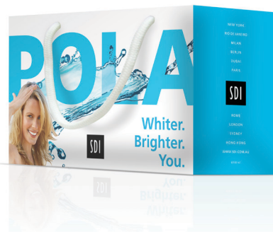
BOLSA SDI Reorder M100141