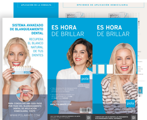
FOLLETOS POLA PARA PACIENTES Pedido M100343